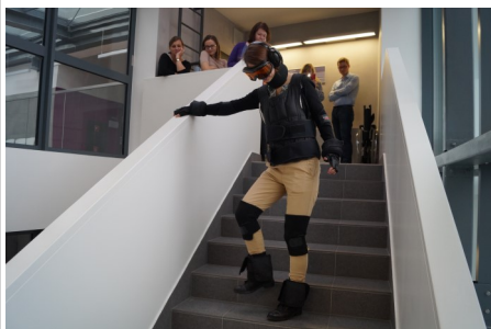
W ramach warsztatów odbyły się zajęcia symulacyjne.

z terenu Metropolii Poznań, w tym osób odpowiedzialnych za przygotowanie inwestycji, pozyskiwanie funduszy zewnętrznych, planowanie przestrzenne oraz obsługę mieszkańców. Celem warsztatów było przybliżenie praktycznych zagadnień związanych z poprawą dostępności przestrzeni publicznej, uwzględniającej potrzeby osób z ograniczeniami mobilności i percepcji. Podczas warsztatów zajęcia prowadzone były w formie wykładów, zajęć w grupach, dyskusji oraz zajęć symulacyjnych.