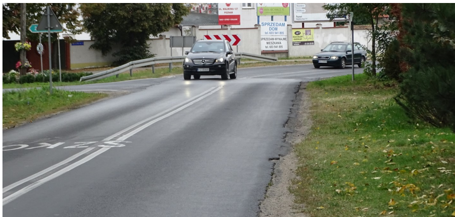
Ul. Poznańska w Skórzewie będzie poszerzona, zyska nową nawierzchnię.

Wniosek na dotację rozbudowy drogi powiatowej nr 2401P Dopiewo – Poznań (ul. Poznańska) w m. Skórzewo dotyczy odcinka od węzła drogowego Dąbrówka na S11 do rejonu ulicy Zakręt. W ramach planowanej przebudowy planuje się wykonać między innymi: wzmocnienie konstrukcji i poszerzenie oraz ułożenie nowej