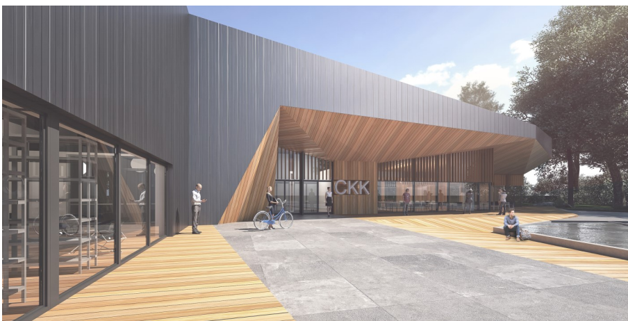
Centrum Tradycji i Kultury w Komornikach – wizualizacja komputerowa.

W Centrum Tradycji i Kultury znajdzie się sala widowiskowa na 300 osób, foyer,